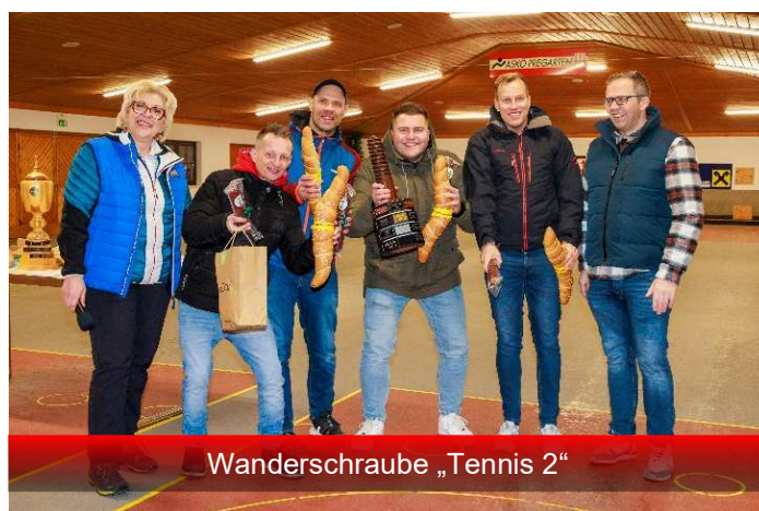
Wanderschraube „Tennis 2“