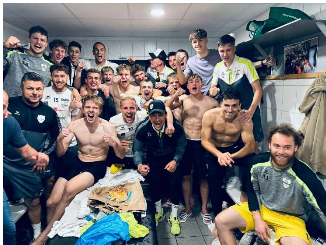
Kampfmannschaft nach letztem Spiel und Klassenerhalt

Die Frühjahrssaison 2024 war geprägt von einem leidenschaftlichen Kampf um den Liga- und Klassenerhalt. Sowohl unsere Kampfmannschaft wie auch unser 1b Team machten es bis zum Schluss spannend und haben sich erst mit einem fulminanten Finish den Verbleib in der OÖ-LT1-Liga bzw. der 1. Klasse Nordost gesichert.