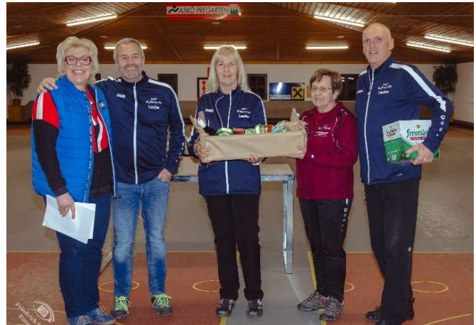
Mixed-Sieger: ESV Kefermarkt