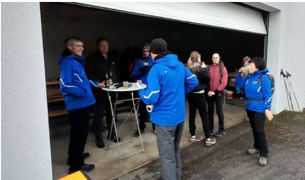
Wanderung in Lasberg und Freistadt

Müllsammeln für eine saubere Umwelt tatkräftig unterstützten wir die Müllsammelaktion unserer Stadtgemeinde.