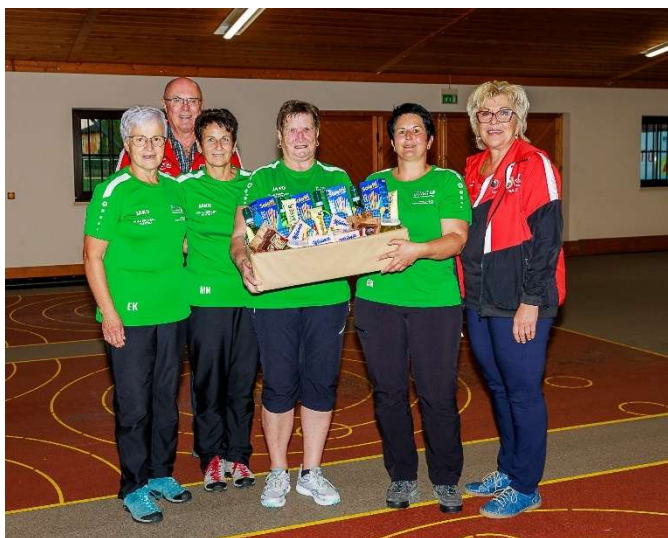
die Siegreichen Damen der SU Niederwaldkirchen

Dieser ging an die Damen der SU Niederwaldkirchen . Dahinter auf Rang 2 punktegleich mit Rang 3 die Damen der ÖTSU St. Marien gefolgt vom ESV Diersbach .