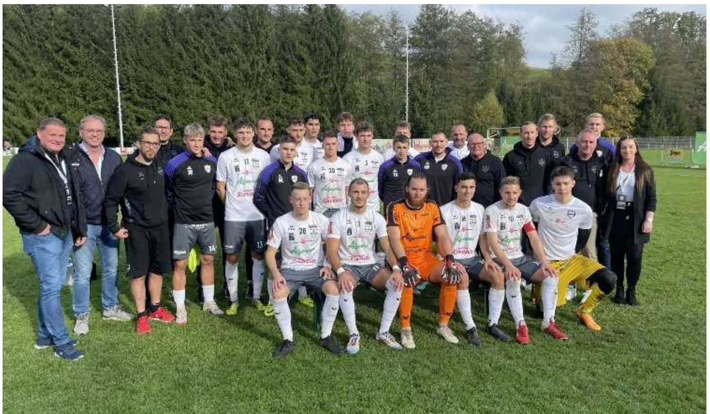
Oben und Mitte - Bilder aus den Heimsiegen gegen Bad Leonfelden und Bad Ischl