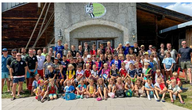
Trainingslager in St. Oswald

Im Sommer stand wieder das traditionelle Trainingslager im Funiversum in St. Oswald mit 80 Kindern am Programm. Diesmal war auch die Talentinnenschmiede mit an Bord.