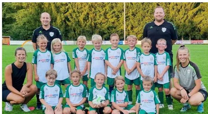
Mannschaft der U7 mit Betreuern

U12, U11 und die U10 mischen ebenfalls ganz vorne in der Tabelle mit, spielerisch gehören unsere Mannschaften zu den absoluten Top-Vereinen im Mühlviertel. Die U9 Mannschaft darf sich ebenfalls Herbstmeister nennen, in 10 Spielen gelangen 9 Siege. Ebenfalls toll geschlagen hat sich die U9 Turniermannschaft, die sich in 3 von 4 Turnieren den ersten Platz sichern konnte. U7 und U8 spielen in der neuen Bewerbsform Funino, wo es vor allem darum geht, dass die Kinder auf viele Einsatzminuten und Ballkontakte kommen, auch hier sieht man im Vergleich mit anderen Mannschaften, dass unsere Spieler:innen bereits über eine sehr gute Grundausbildung verfügen.