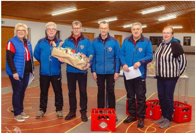
Herrensieger: SU Schweinbach

Großen Jubel gab es bei ESV Kefermarkt , stark und souverän spielten sie auf und durften über den 1. Rang jubeln, Rang 2 ging an SK Bad Wimsbach und Rang 3 ASKÖ Treffling